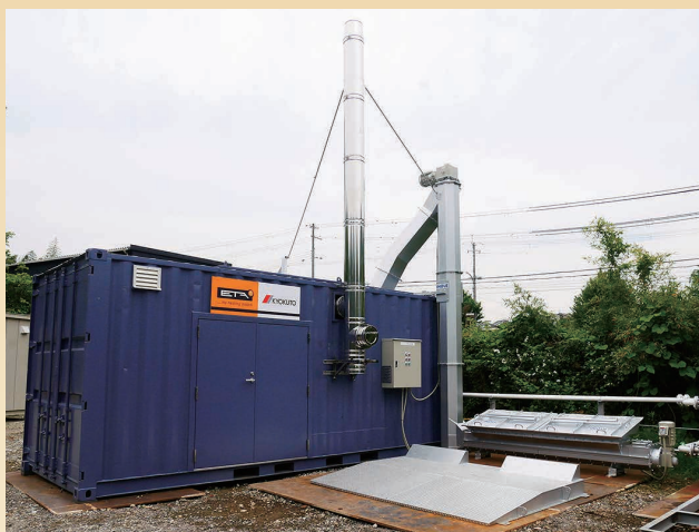
SC30-HV 搬送能力：20m 3 /h