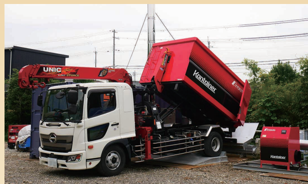
ダンプアップによる水平スクリューへのチップ受入