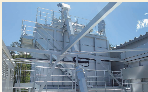
SC40-V 搬送能力：30m 3 /h 傾斜角 73°