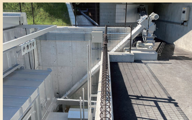
SC20-V 搬送能力：2m 3 /h 傾斜角 45°