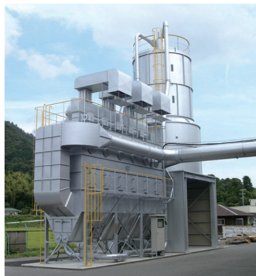
BFR5×6(22kW×3) トラック積載 LCA500