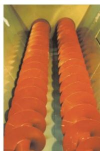
スクリーコンベヤ