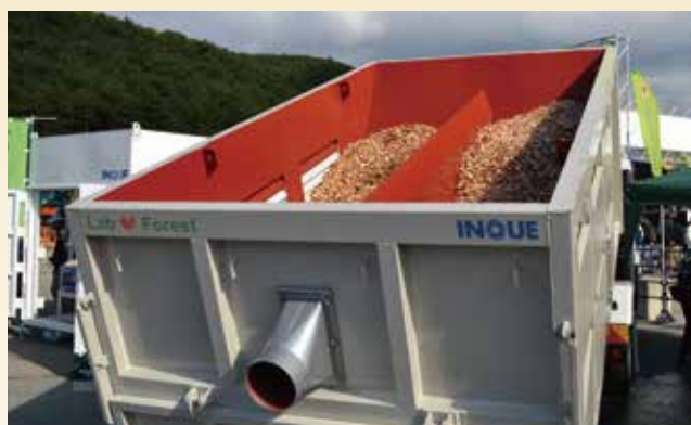
乾燥用温風の給気口と乾燥機構