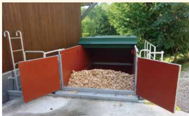
燃料チップの受入・排出装置への応用(固定式)