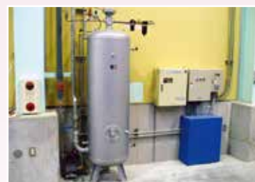
水消火加圧タンク 自動給水式